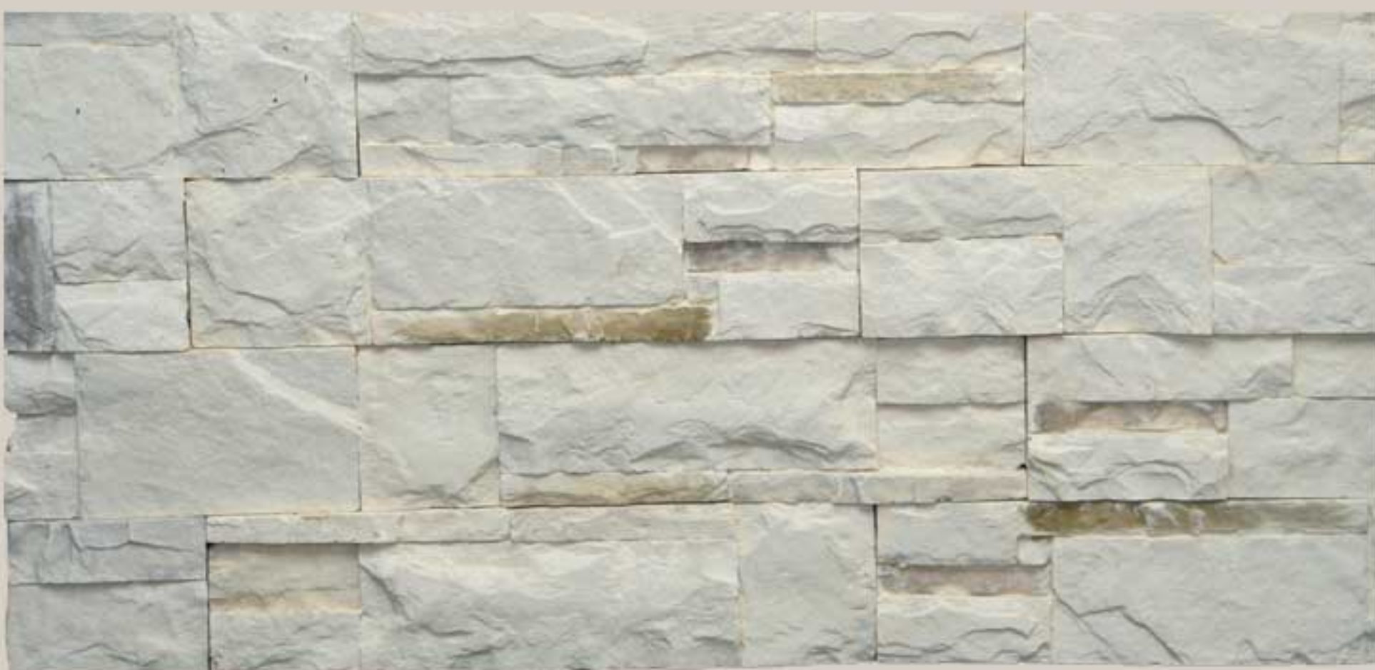
Lithos stone Cream