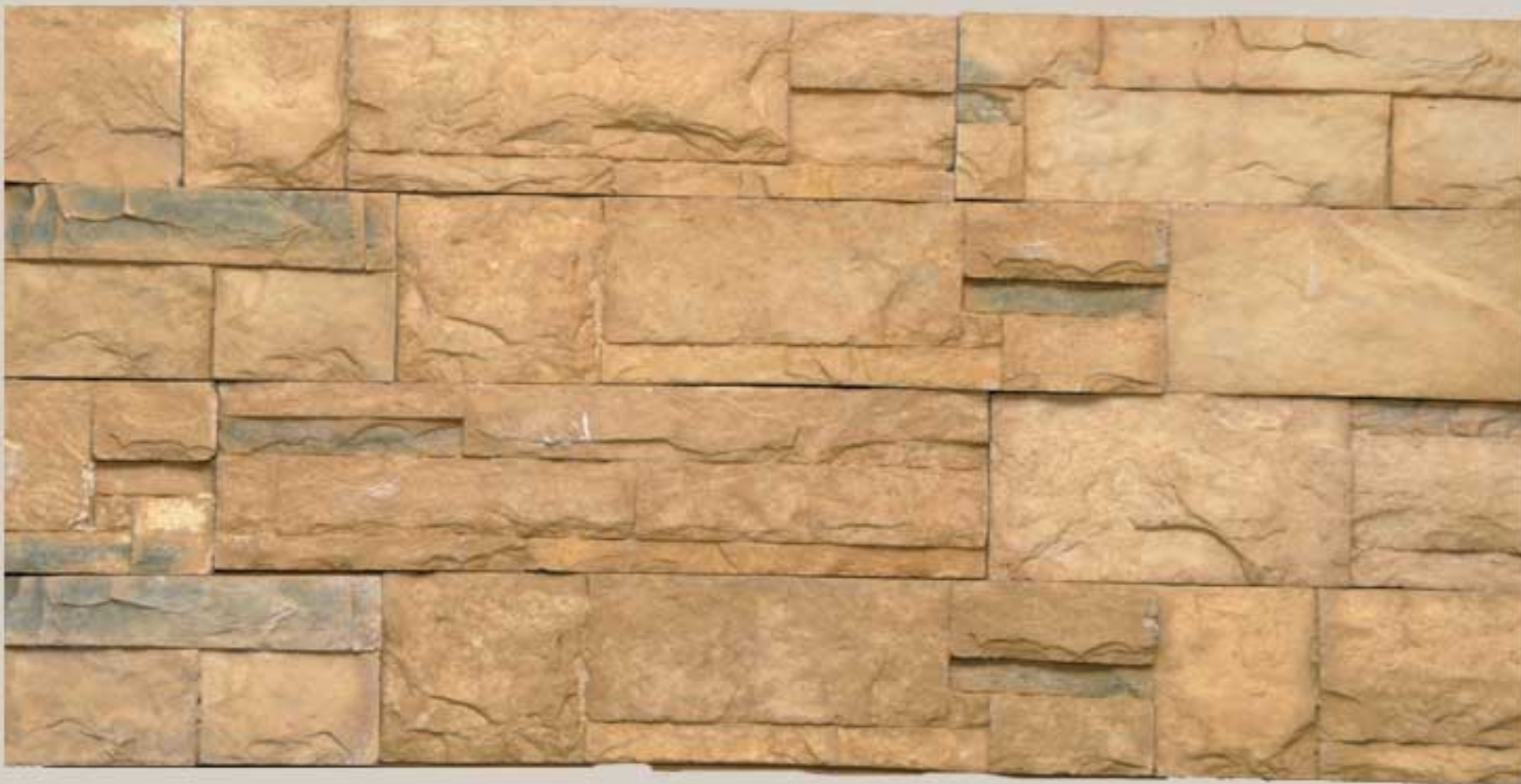
Lithos stone Gold