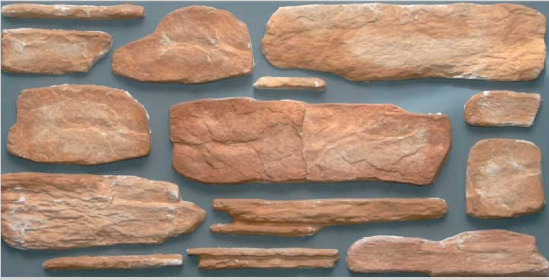
Basic stone Brown