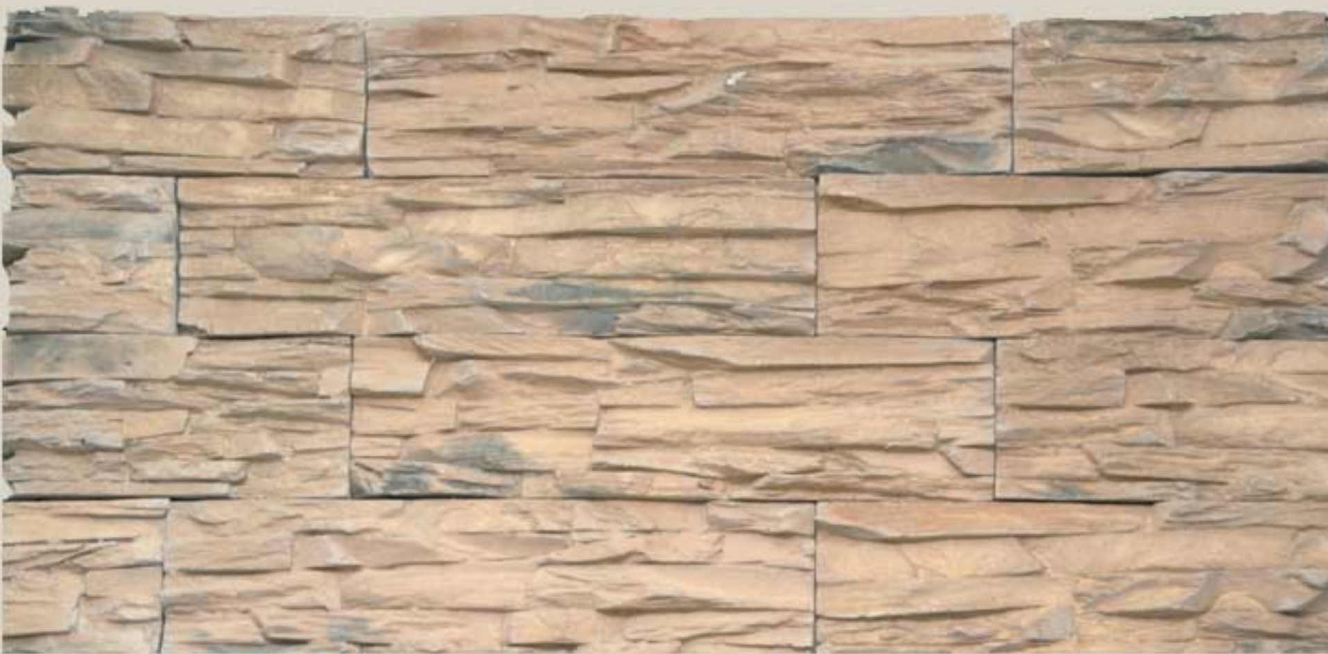
Lamellar stone Harvest Sand