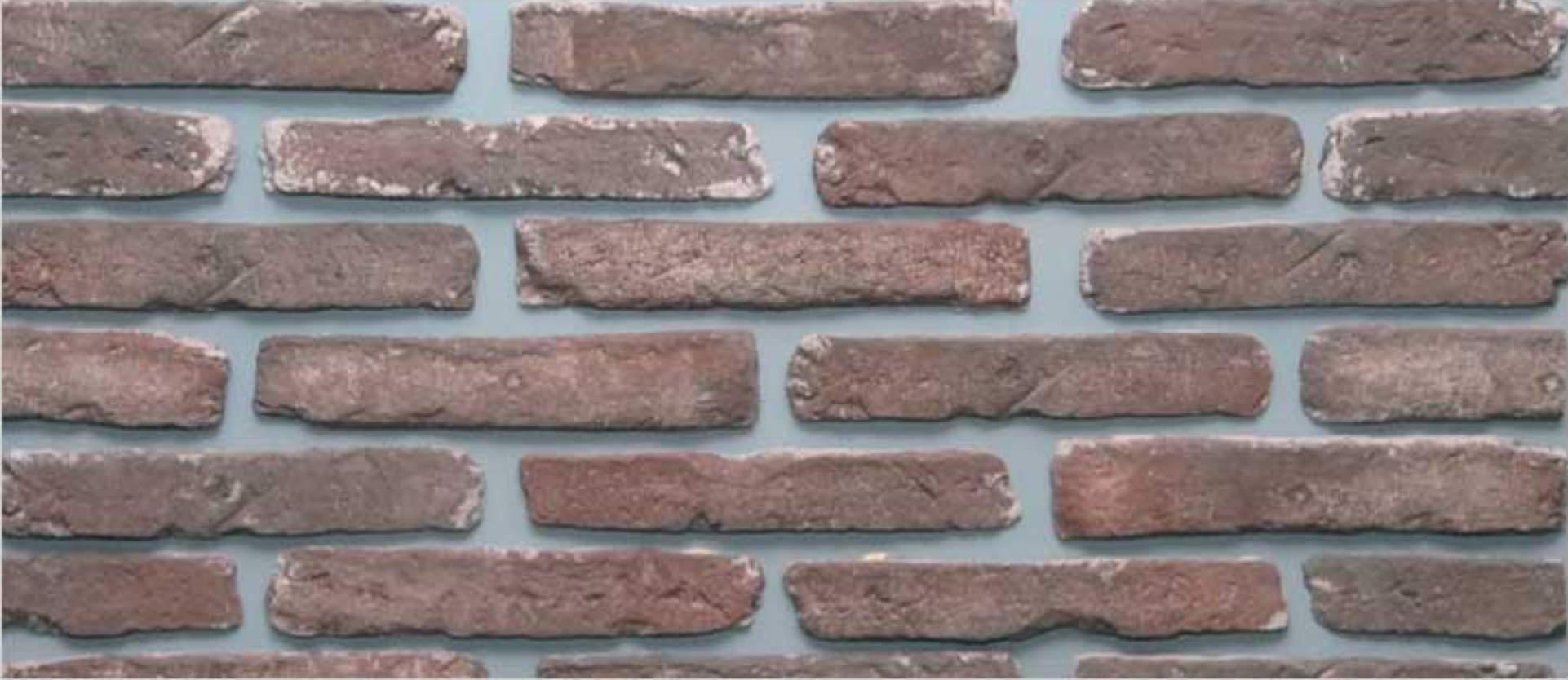
Roman brick Terra Cotta