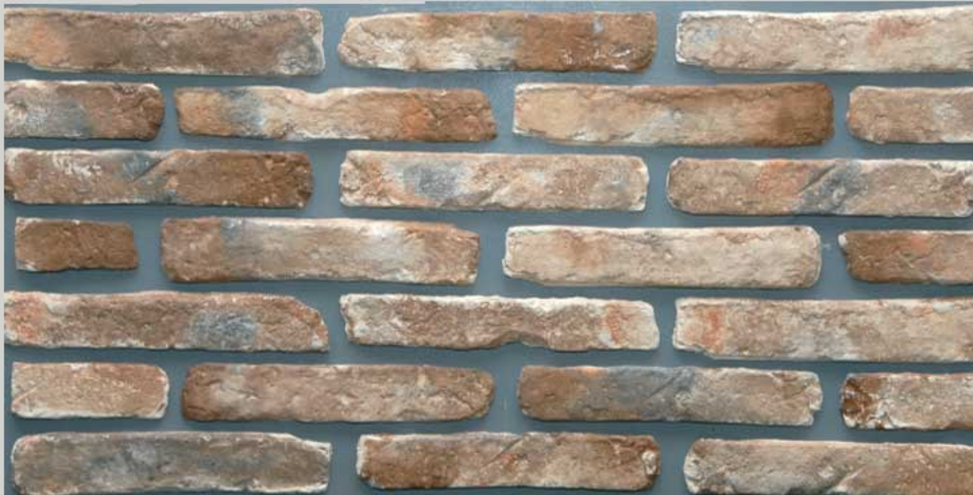
Roman brick Rustica