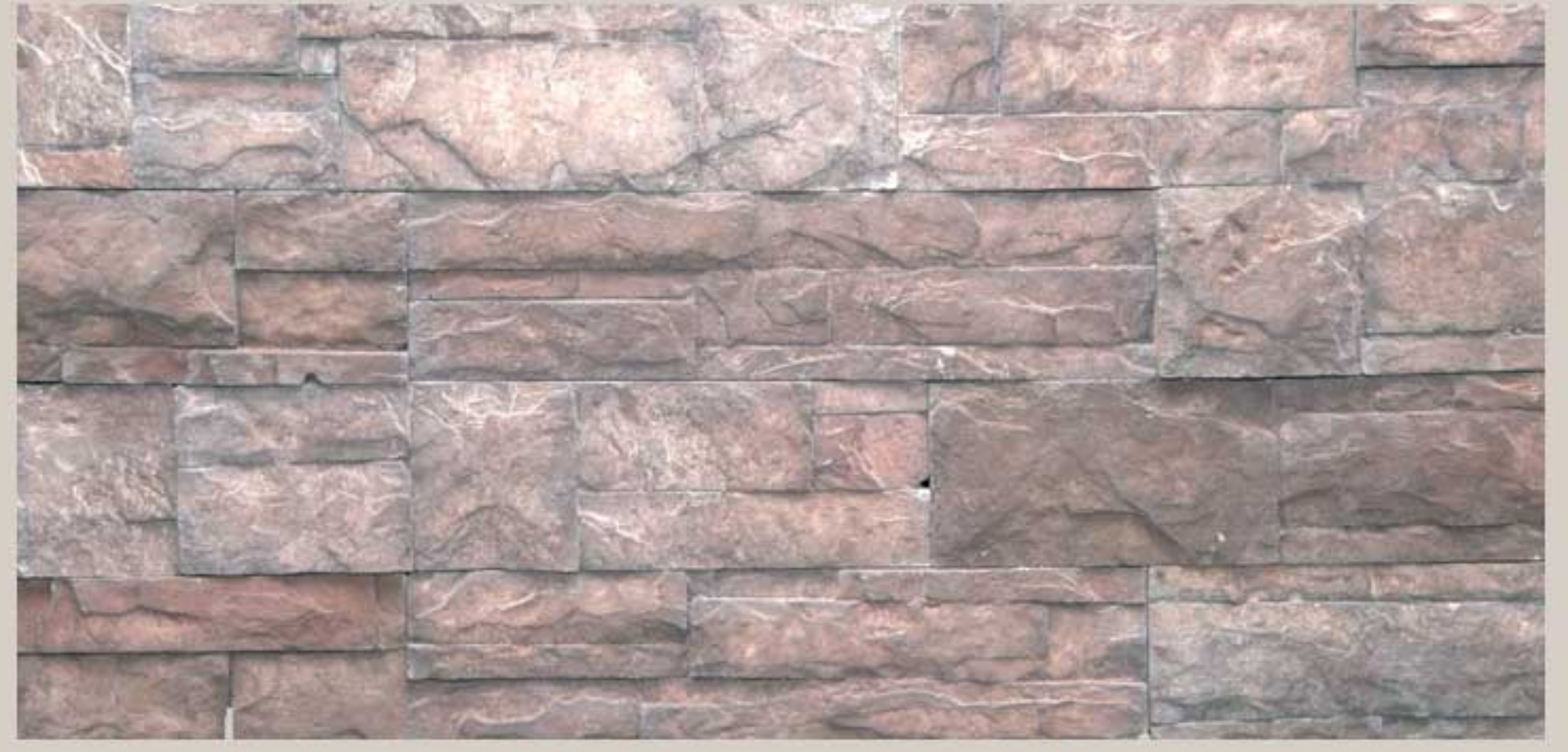
Lithos stone Rust Brown