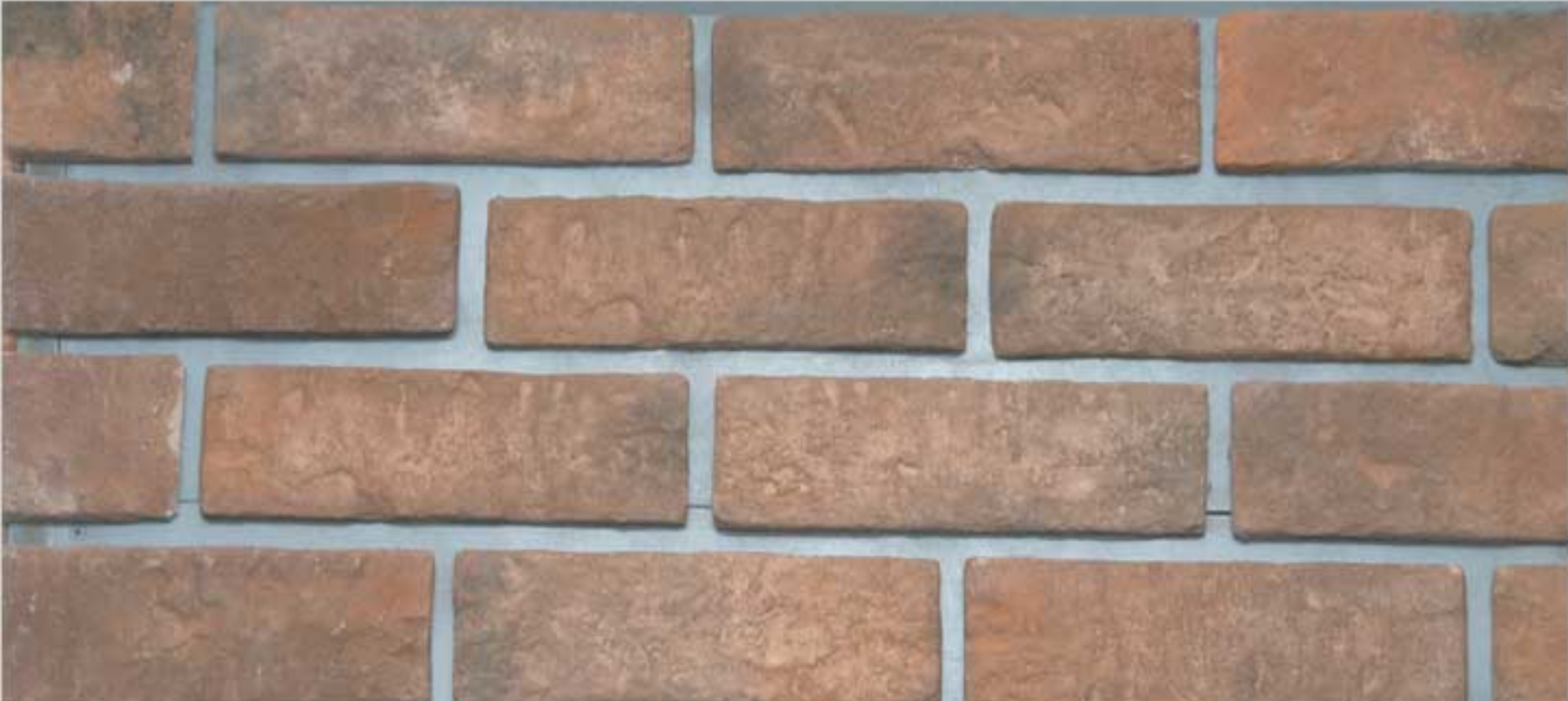
Loam brick Brown