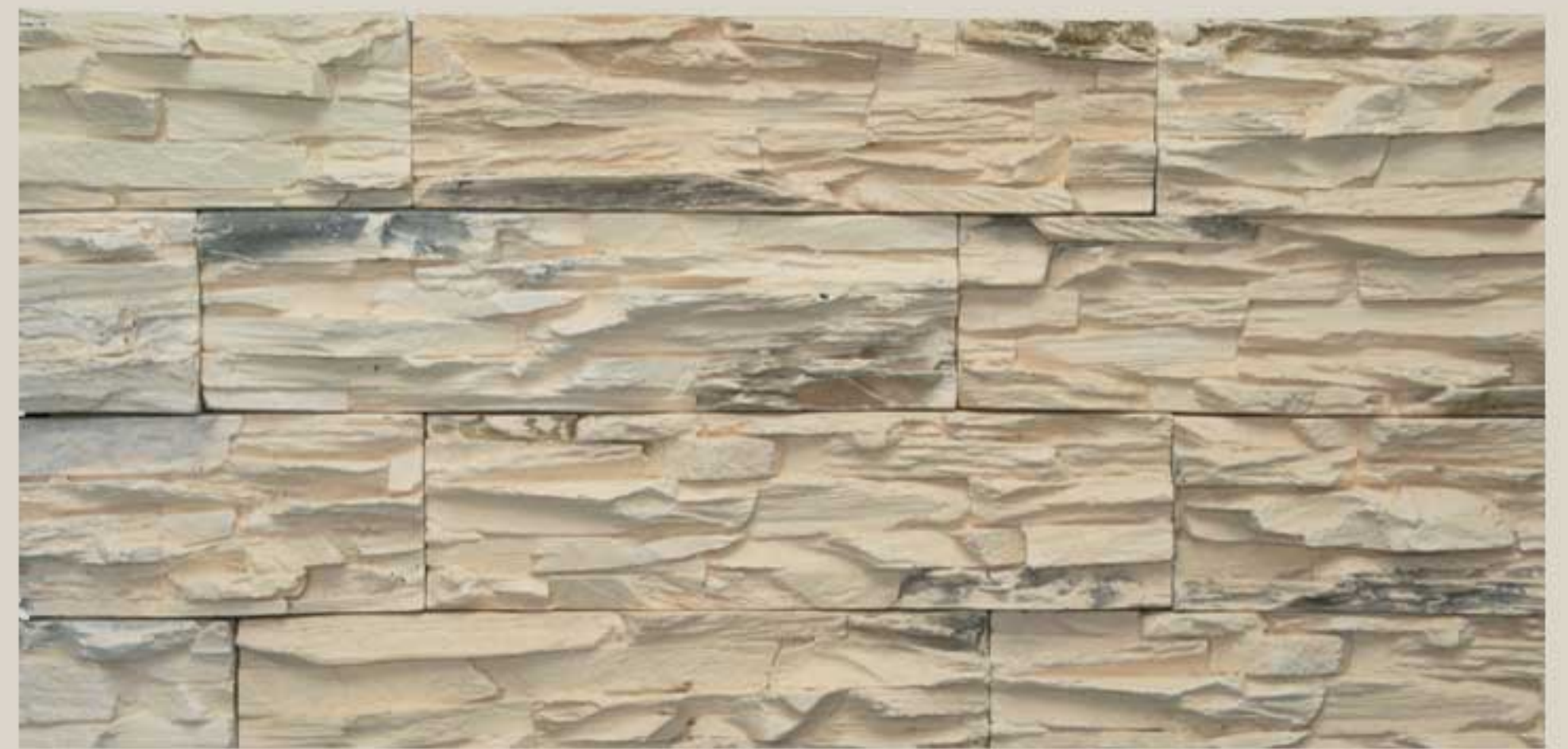
Lamellar stone Peach