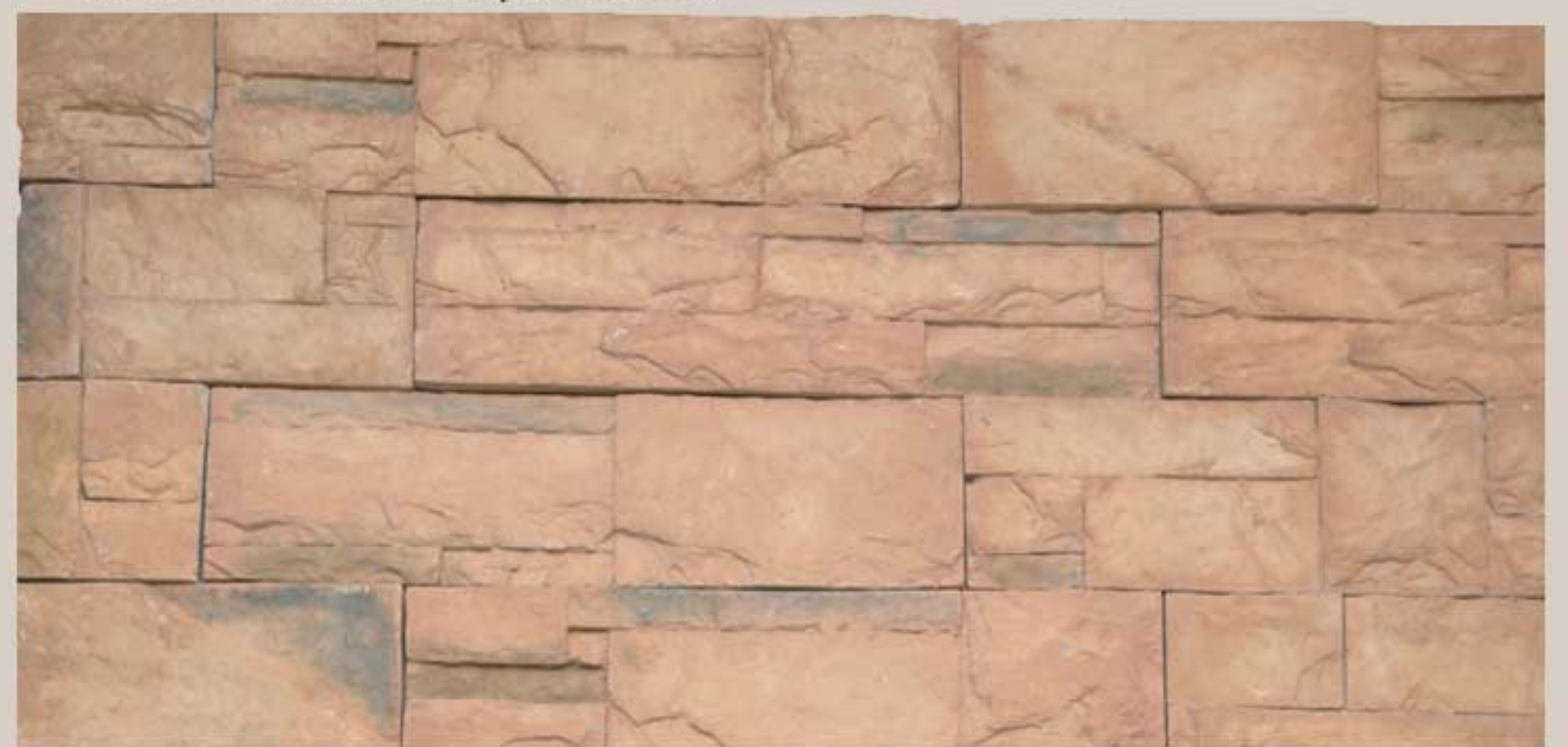
Lithos stone Maplewood