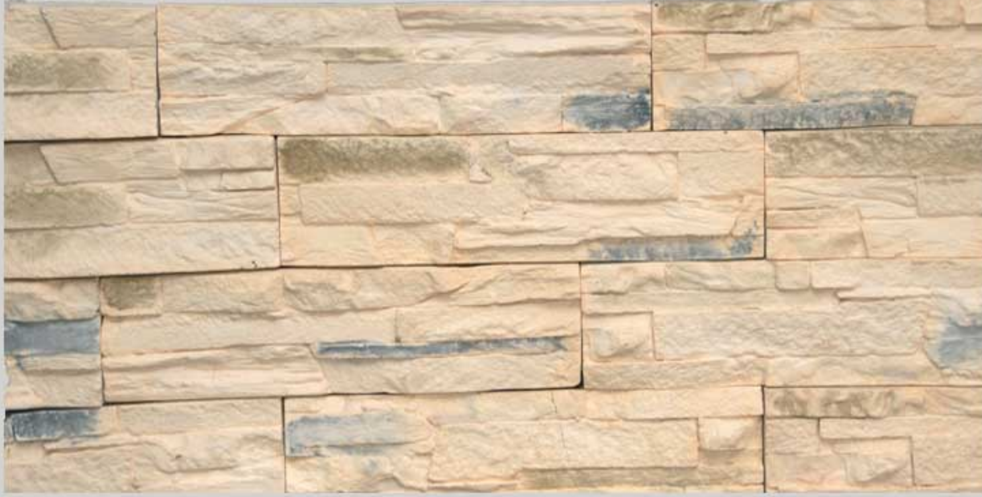
Ledge stone Peach