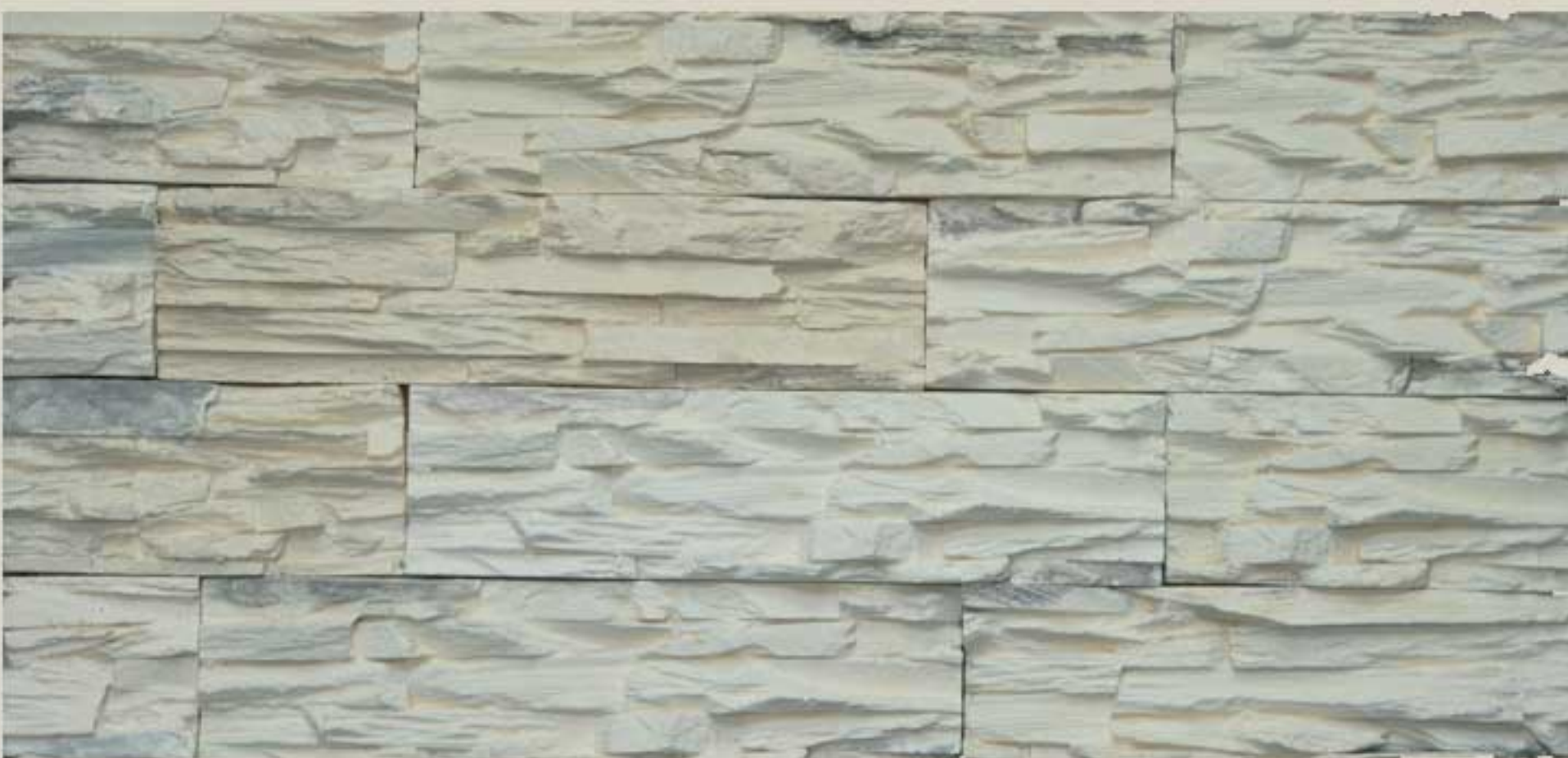
Lamellar stone Cream