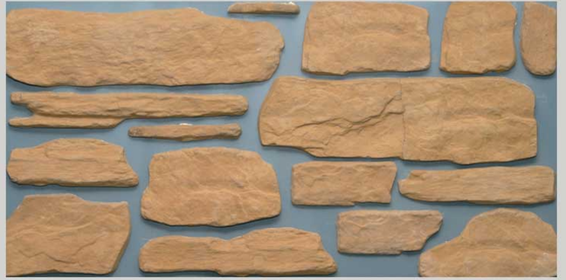
Basic stone Gold