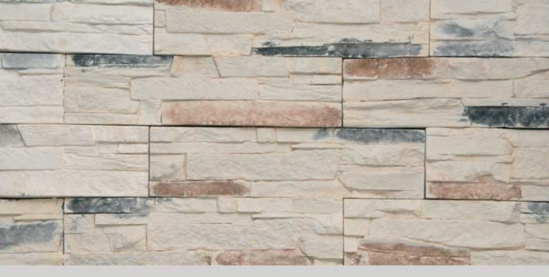
Ledge stone Cream