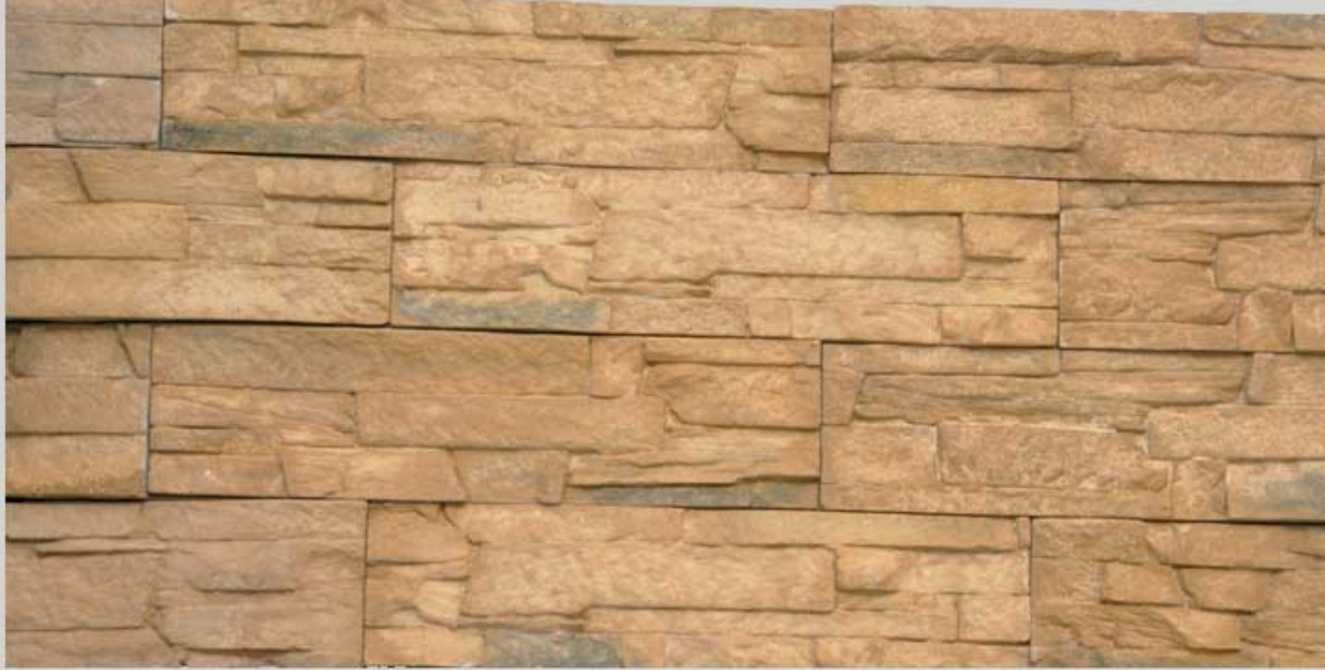
Ledge stone Gold