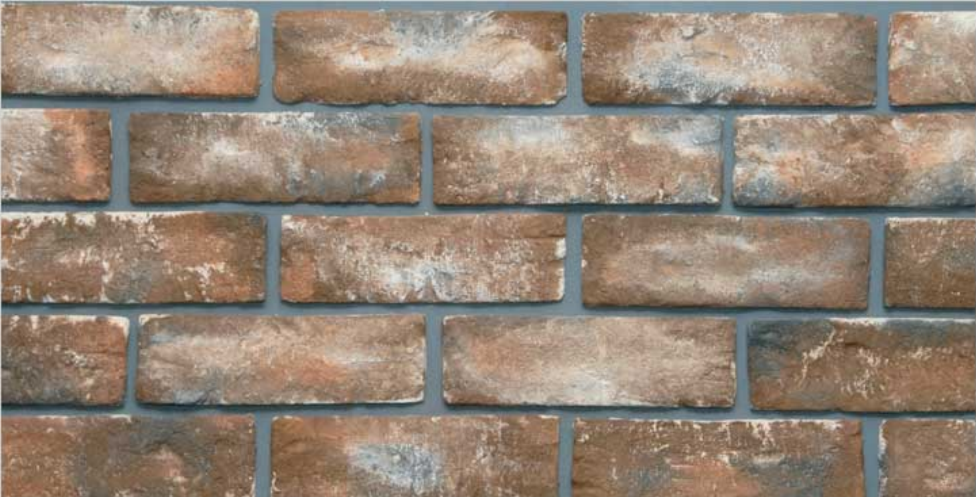
Loam brick Rustica