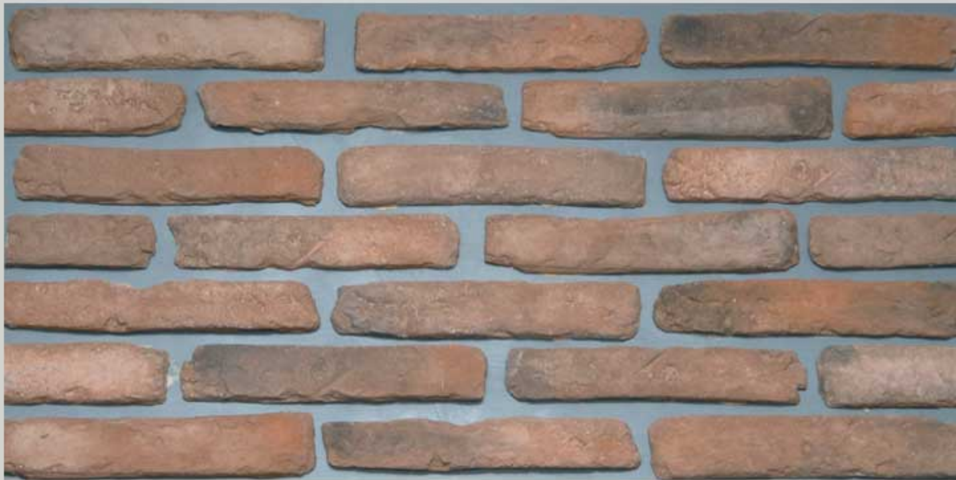
Roman brick Brown