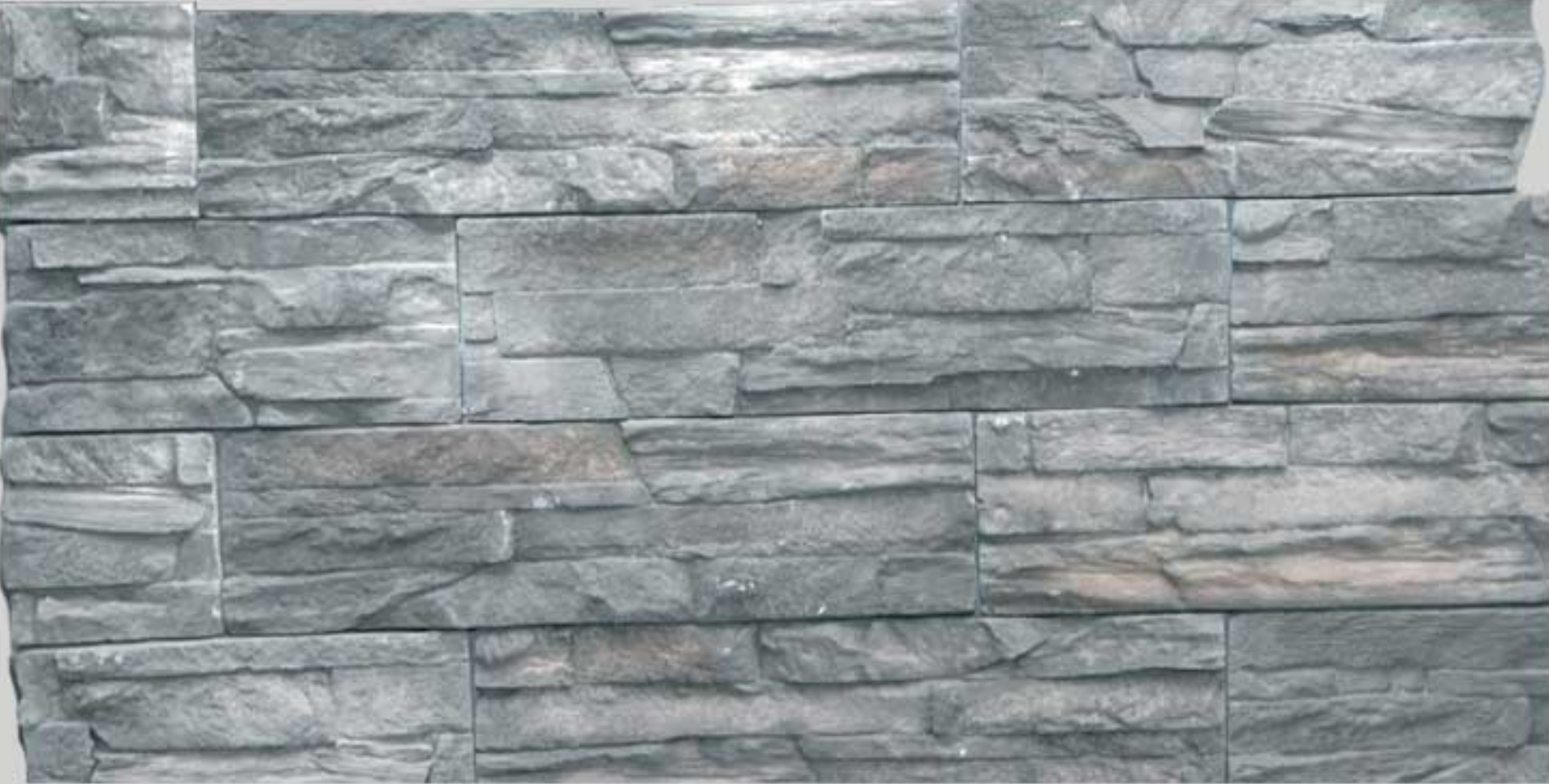
Ledge stone Grey