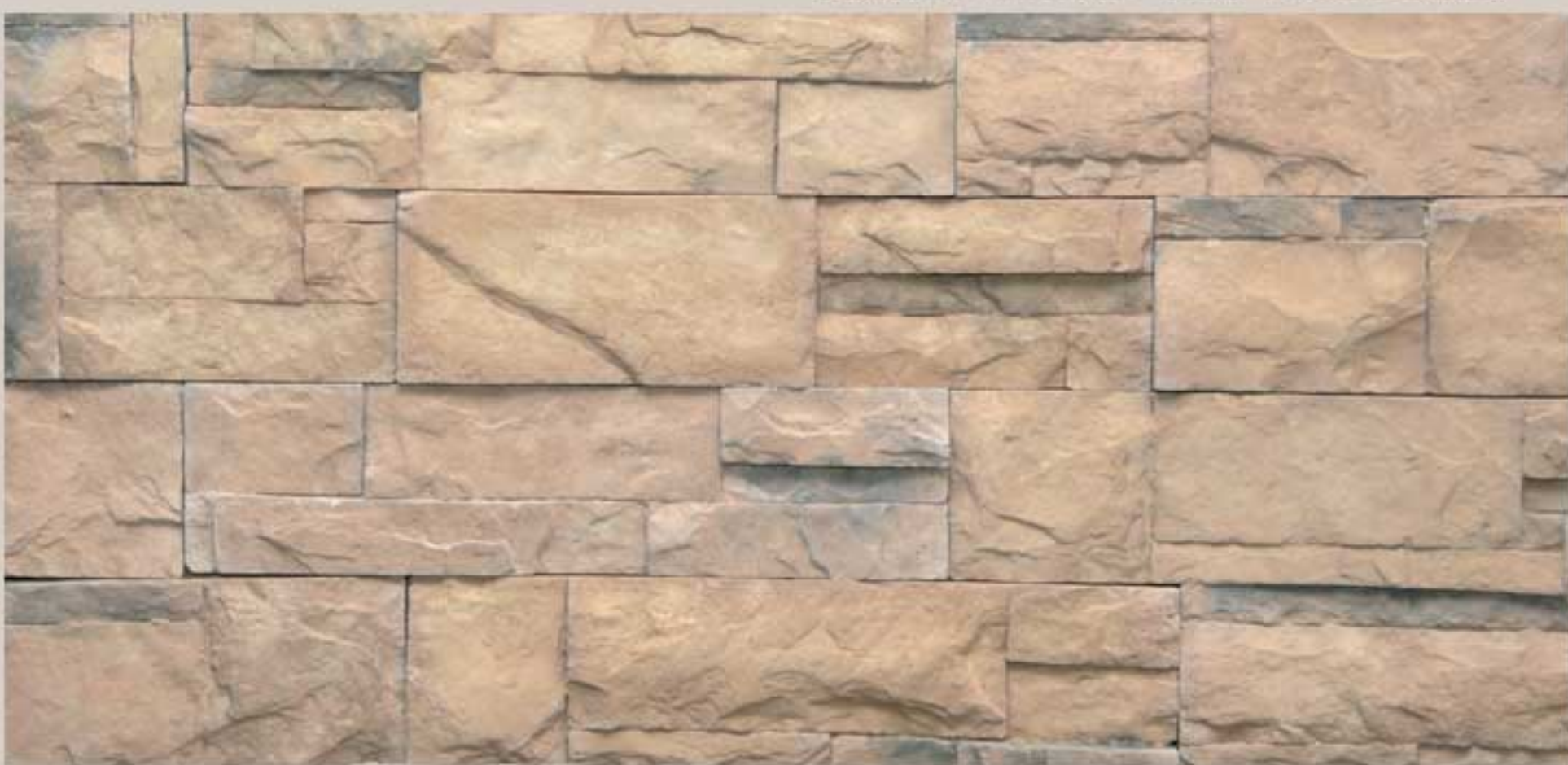
Lithos stone Harvest Sand