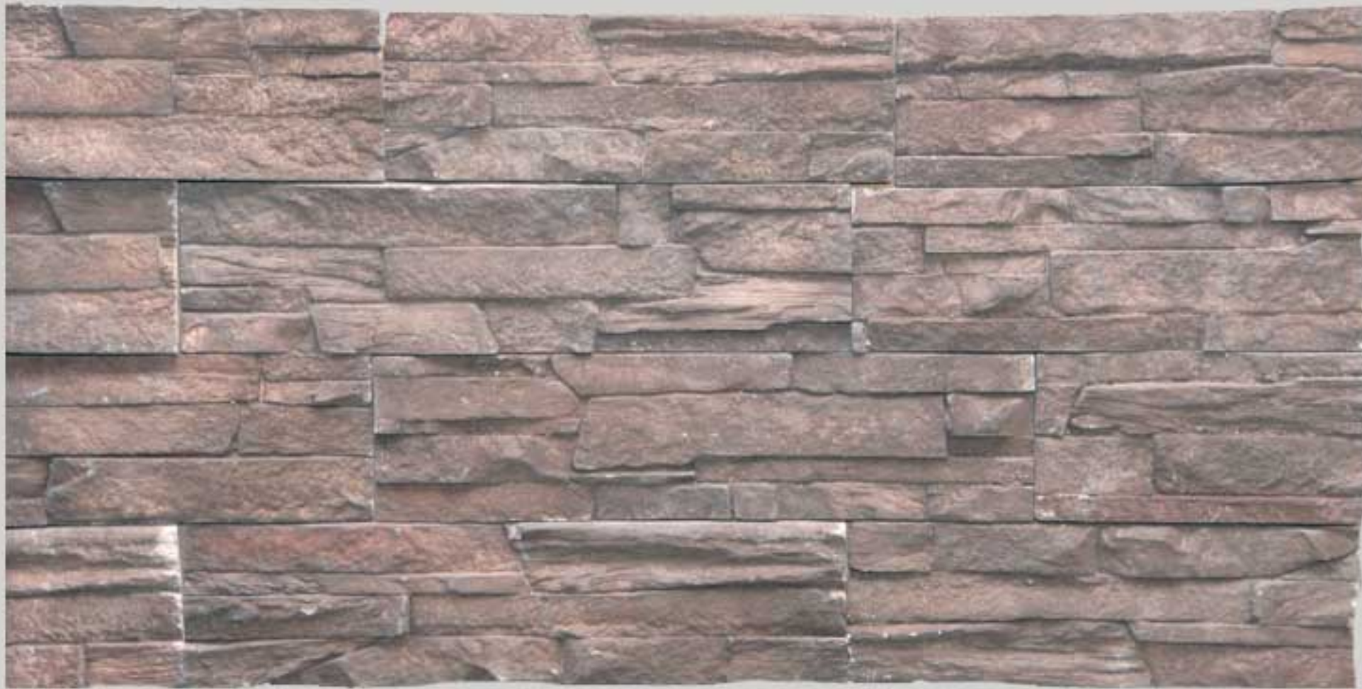
Ledge stone Rust Brown