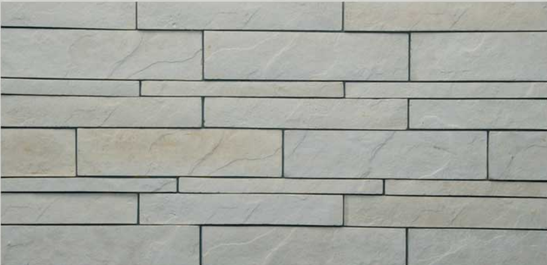
Italian slate Cream