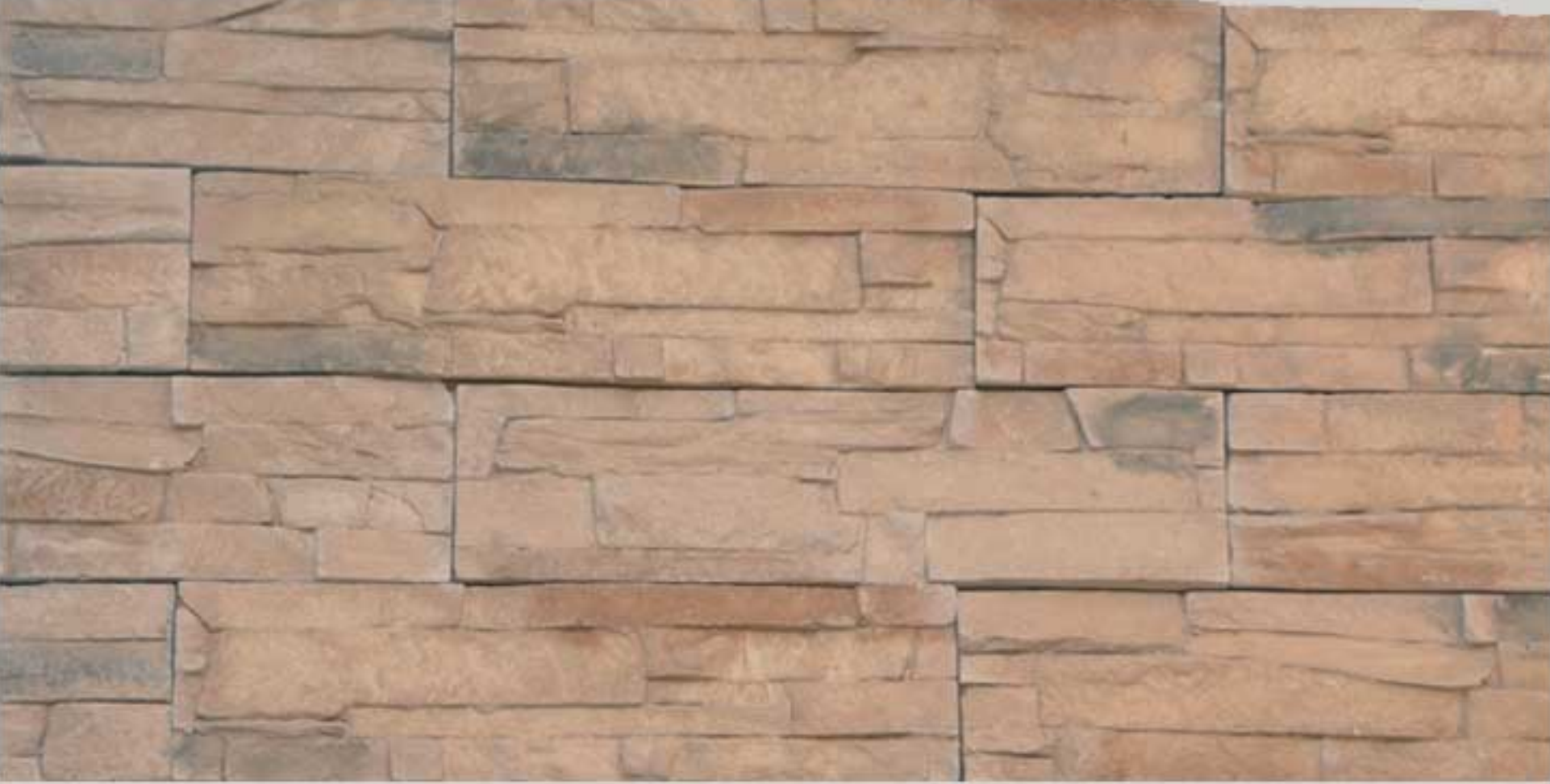
Ledge stone Harvest Sand