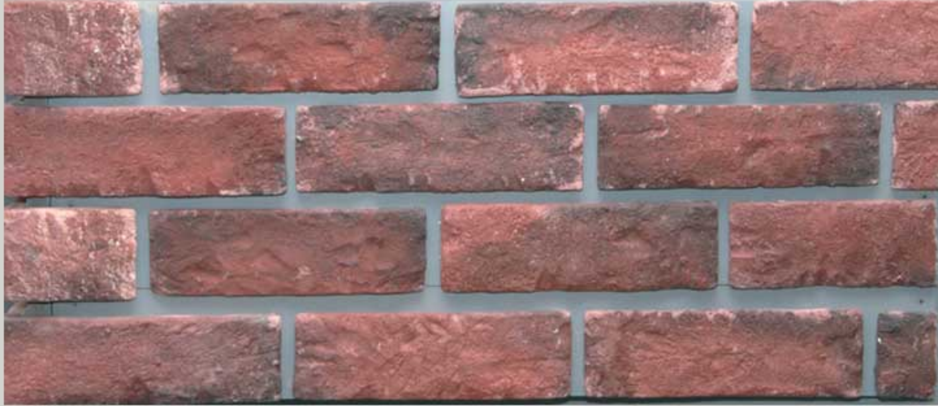
Loam brick Red