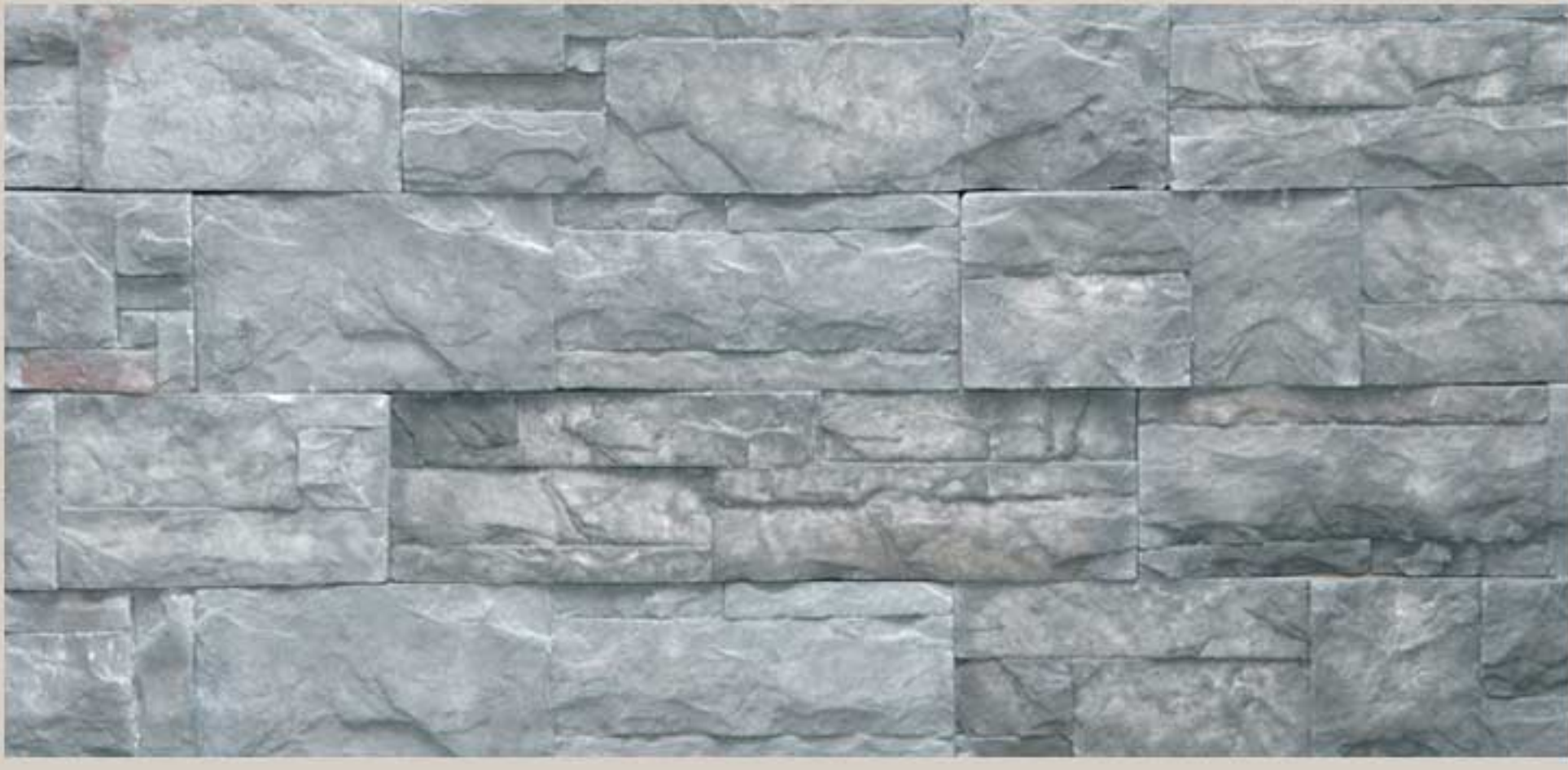
Lithos stone Grey