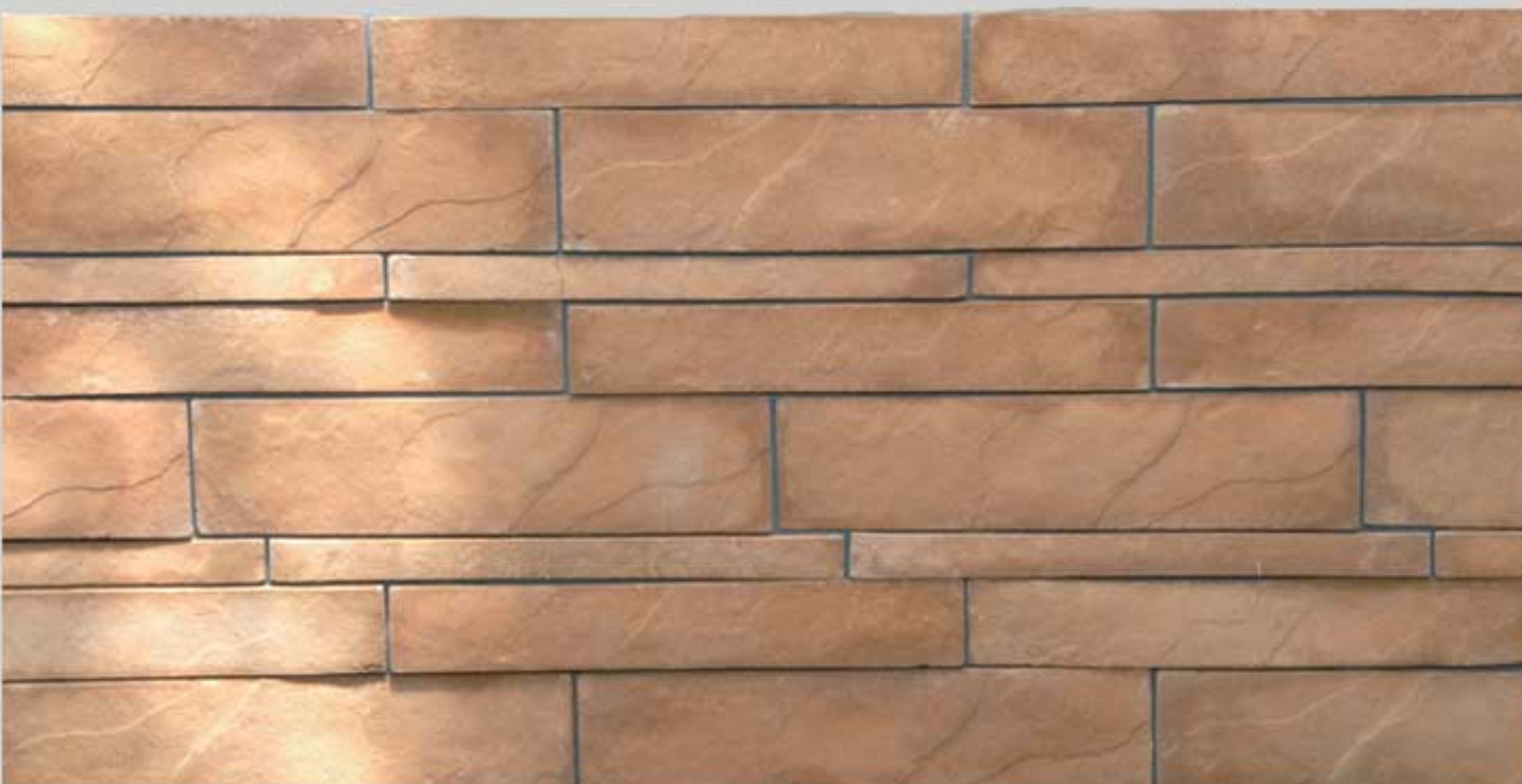
Italian slate Maplewood