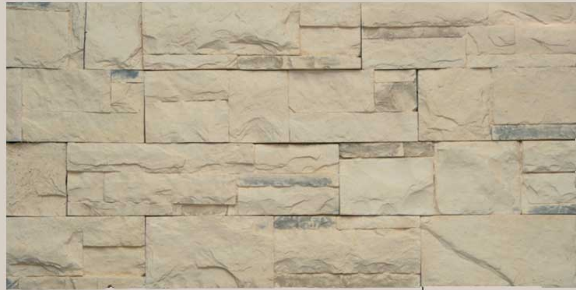
Lithos stone Peach