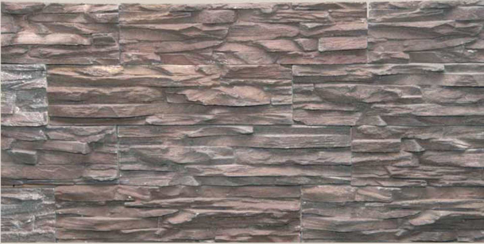
Lamellar stone Rust Brown