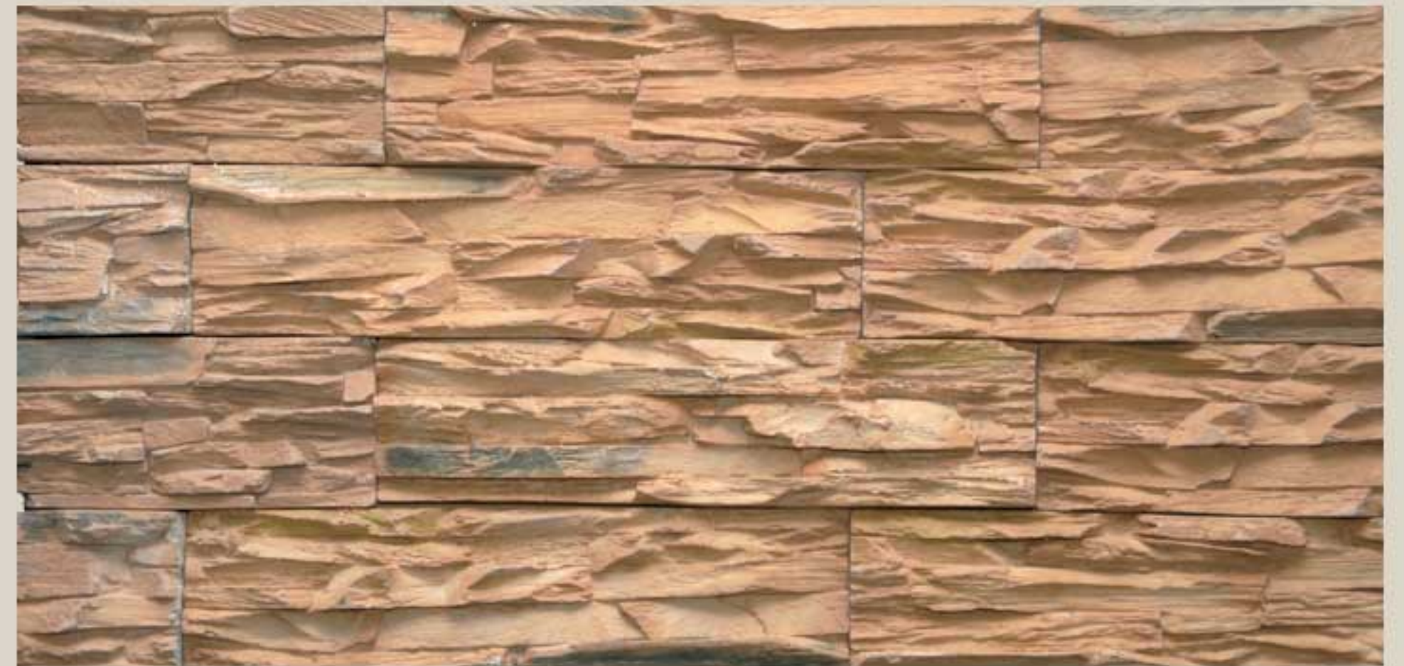
Lamellar stone Maplewood