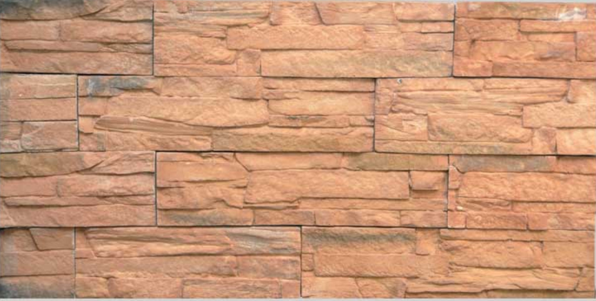
Ledge stone Maplewood