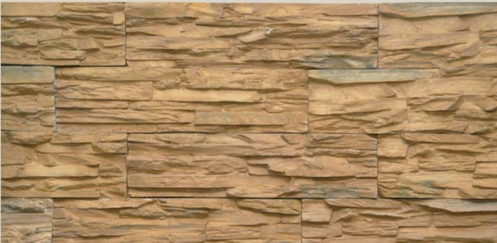
Lamellar stone Gold