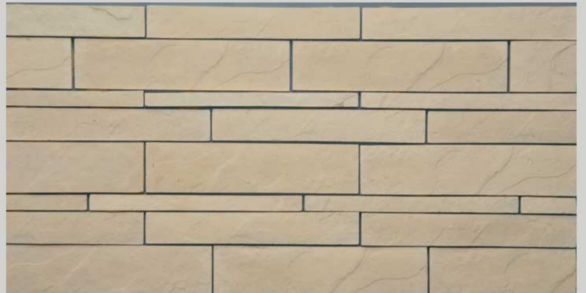
Italian slate Peach