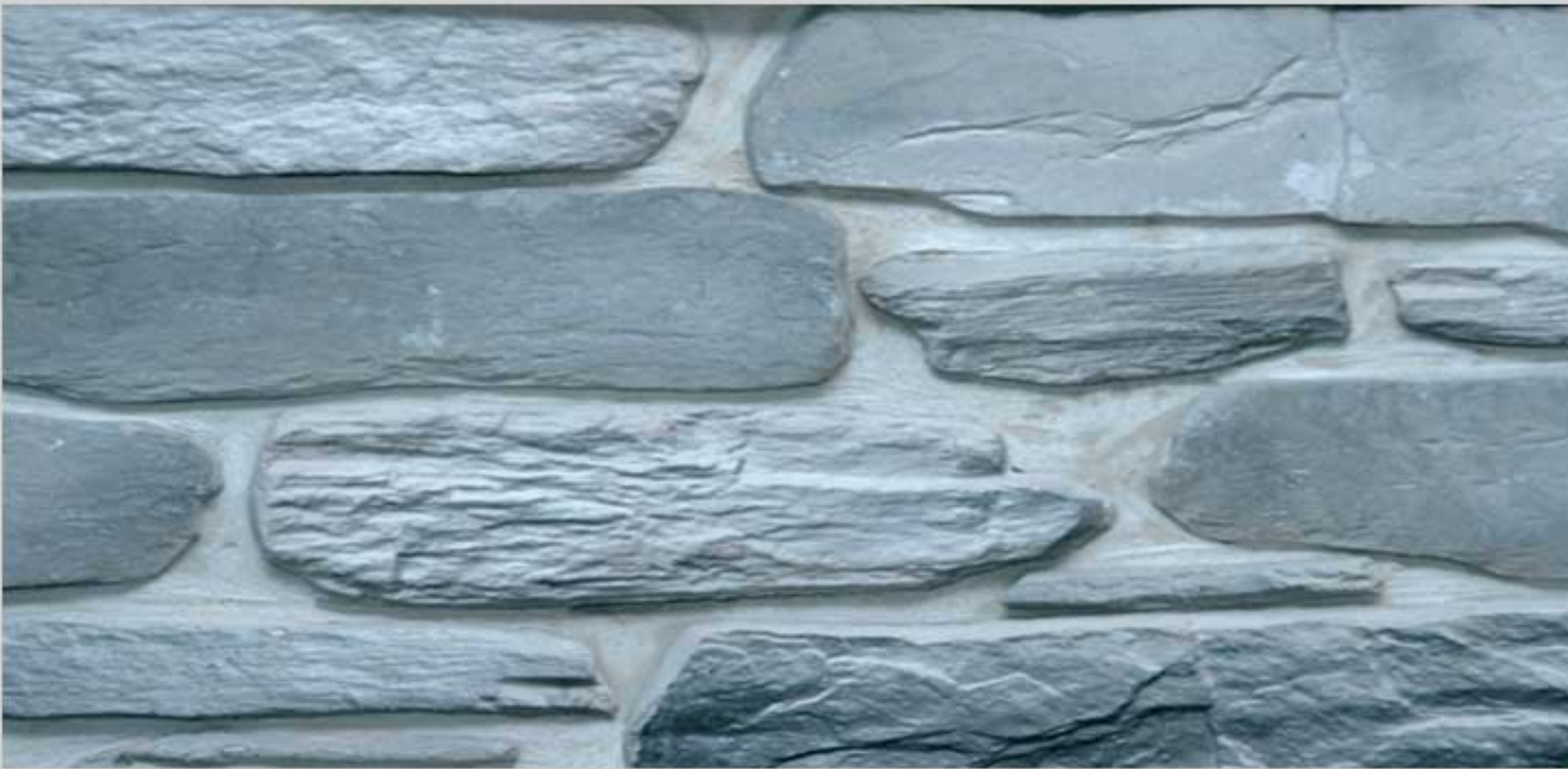
Basic stone Grey