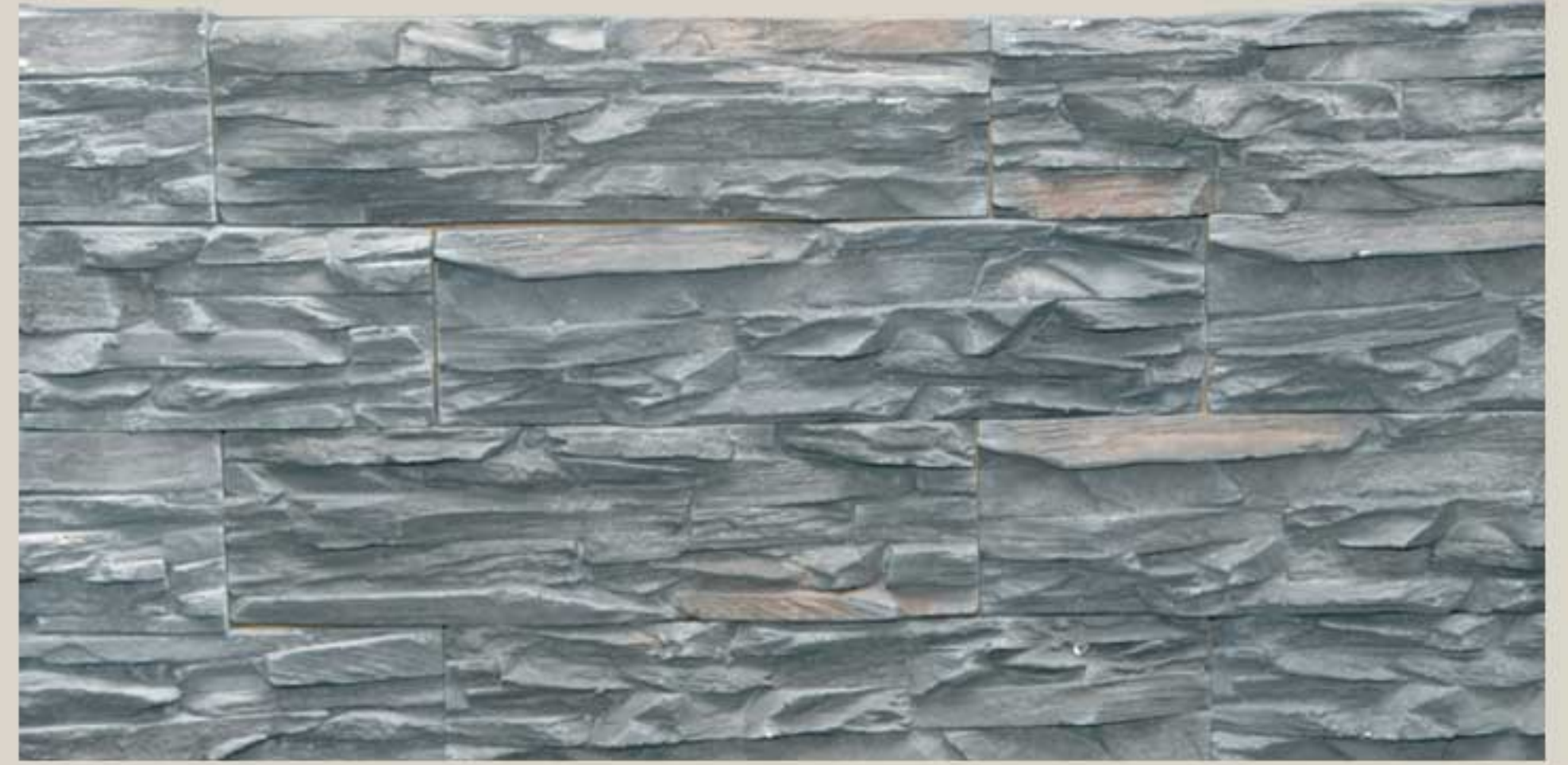
Lamellar stone Gray